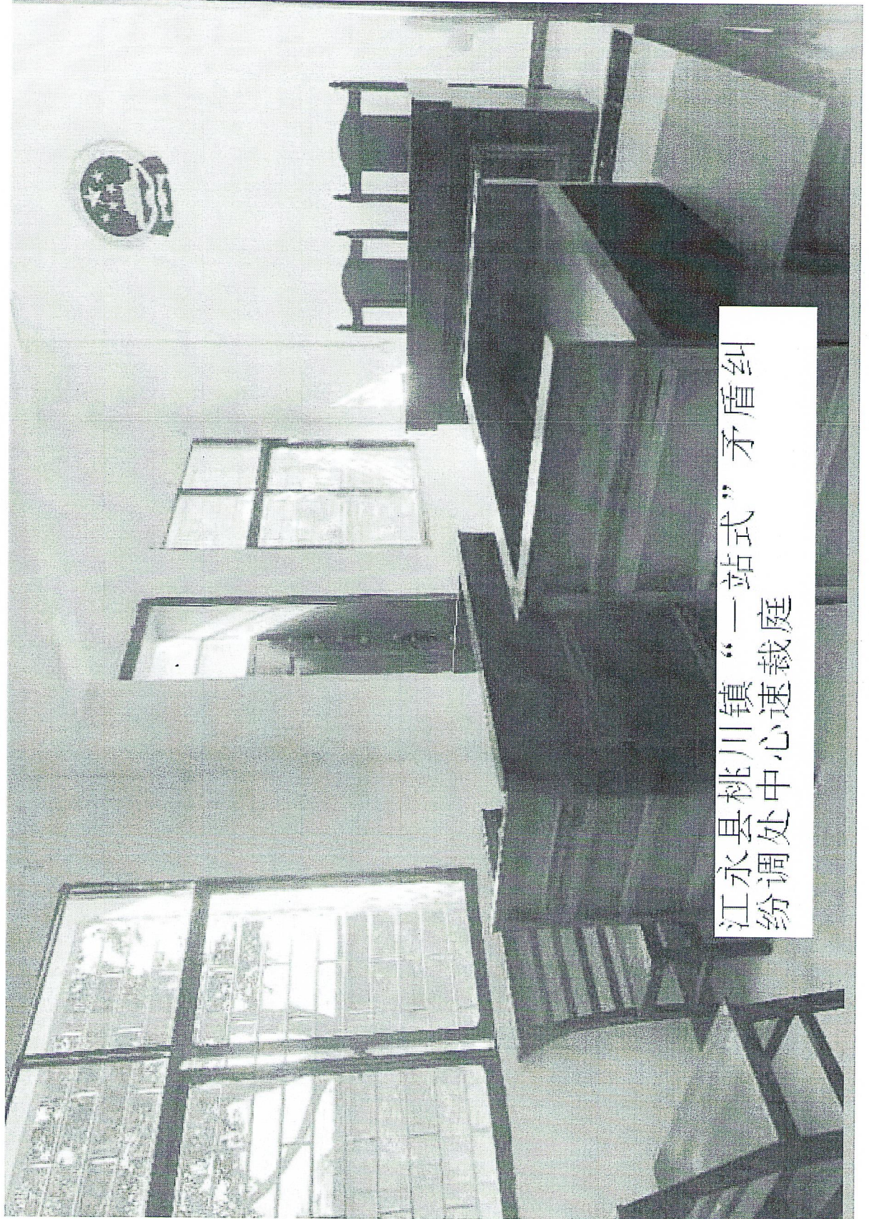
江永县桃川镇“一站式”矛盾纠纷调处中心速裁庭