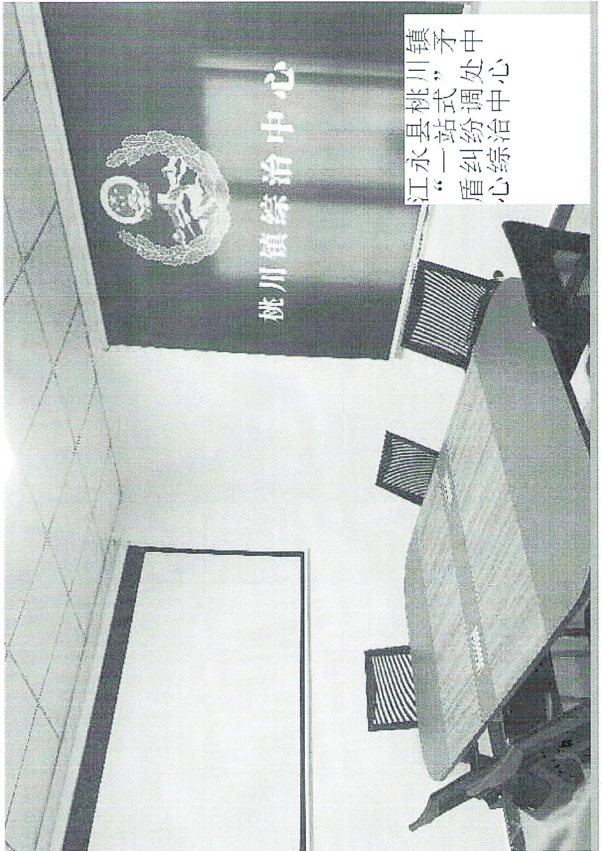
江永县桃川镇矛盾纠纷一站式调处中心